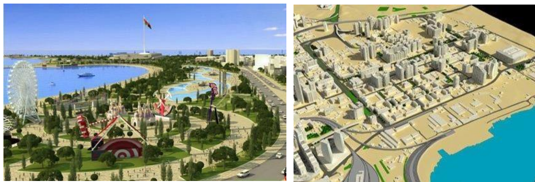
Концепция развития Бакинского бульвара

Бакинский бульвар в скором будущем будет выглядеть по-новому, разрабатывается концепция развития побережья Бакинской бухты, с учетом всех особенностей современных архитектурных направлений и ландшафтного дизайна.